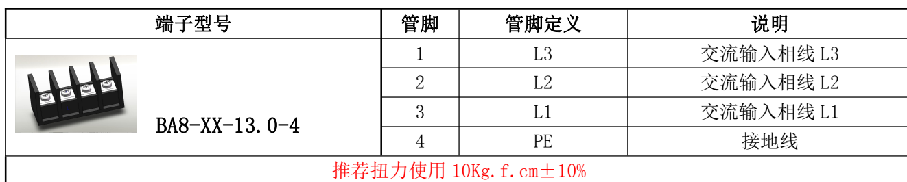
表 10 输入管脚定义表