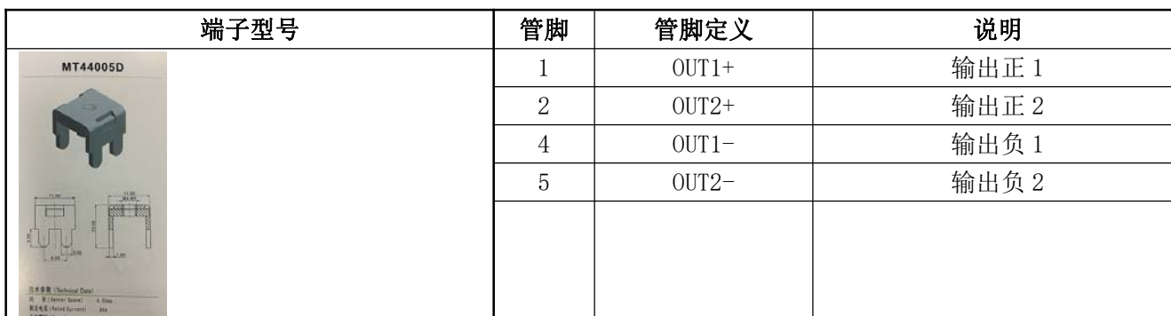
表 12 输出管脚定义表