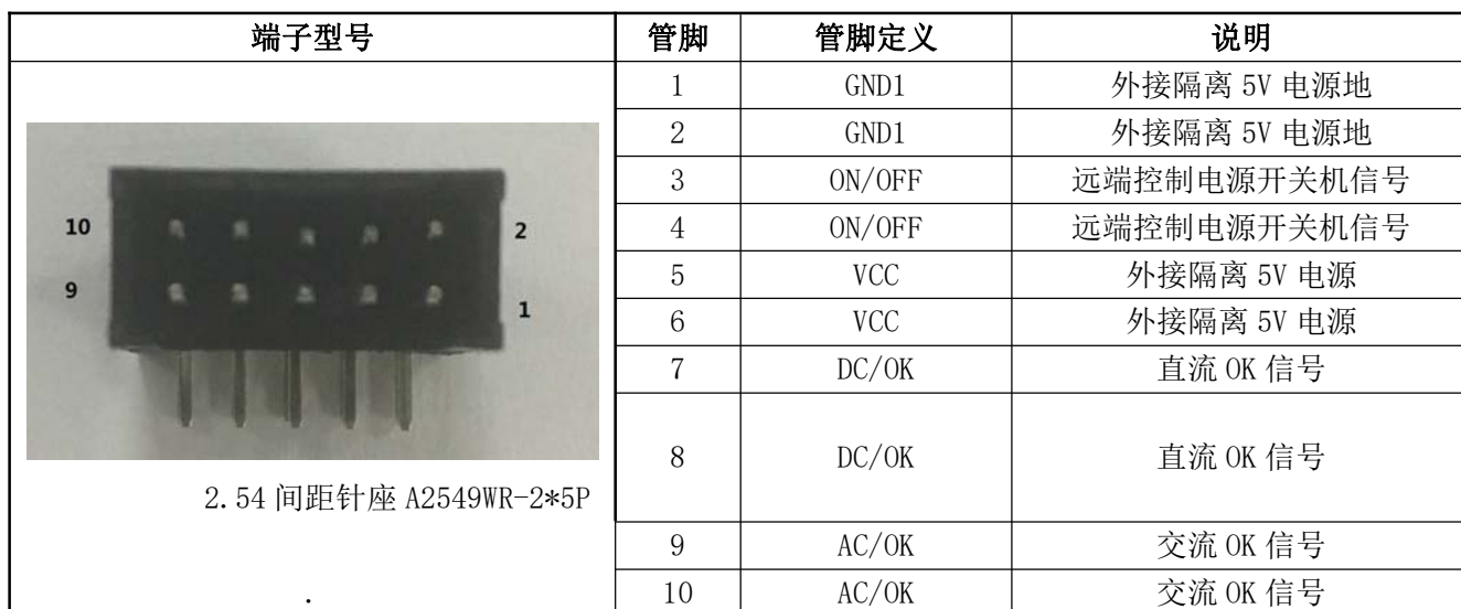
表 13 输出管脚定义表