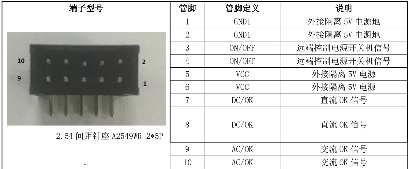
表 13 输出管脚定义表