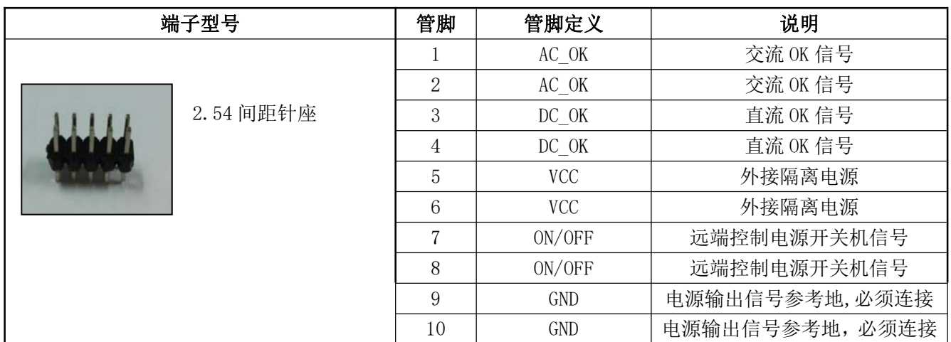
表 13 输出管脚定义表