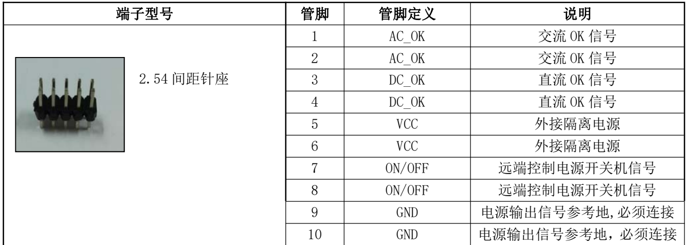
表 13 输出管脚定义表