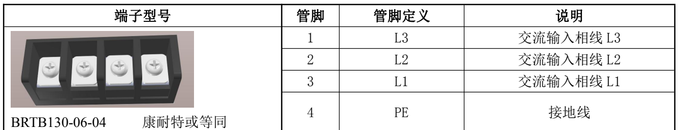
表 10 输入管脚定义表