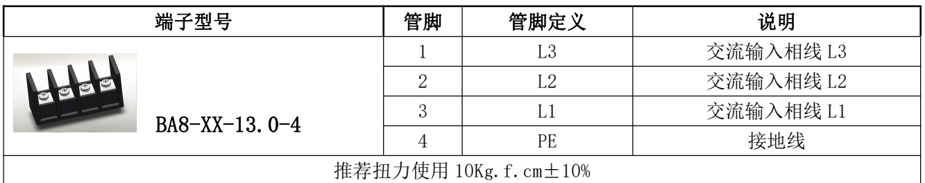
表 10 输入管脚定义表