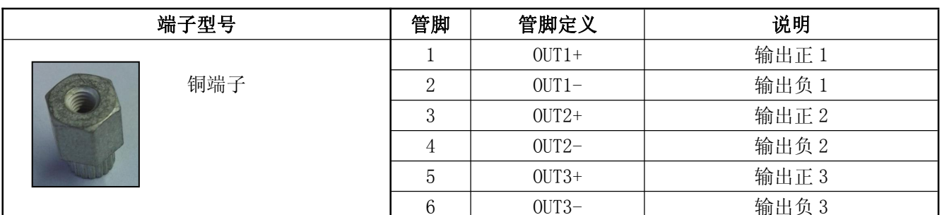
表 12 输出管脚定义表