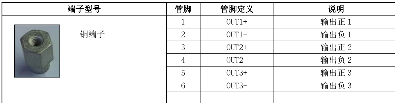
表 12 输出管脚定义表