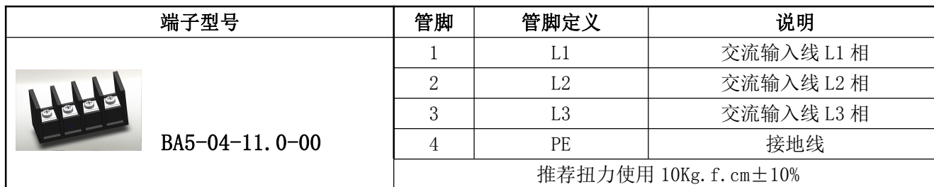
表 10 输入管脚定义表