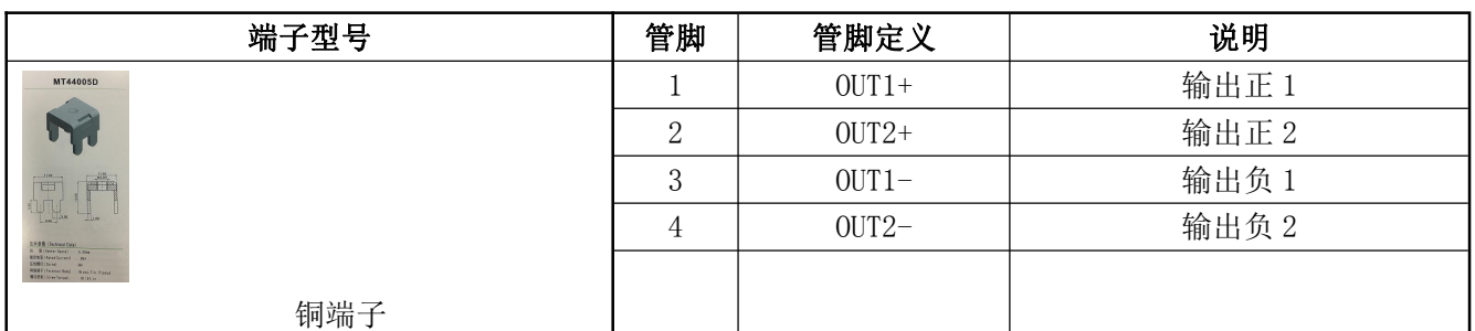
表 11 输出管脚定义表