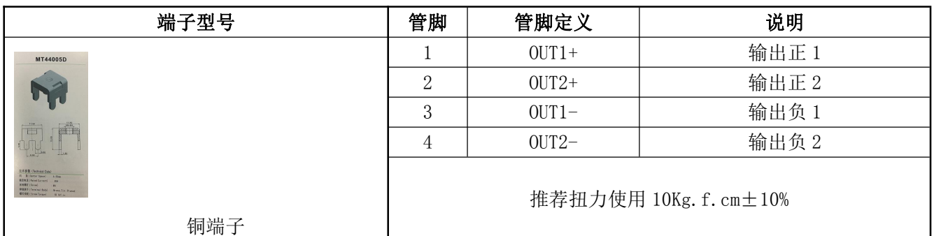
表 11 输出管脚定义表