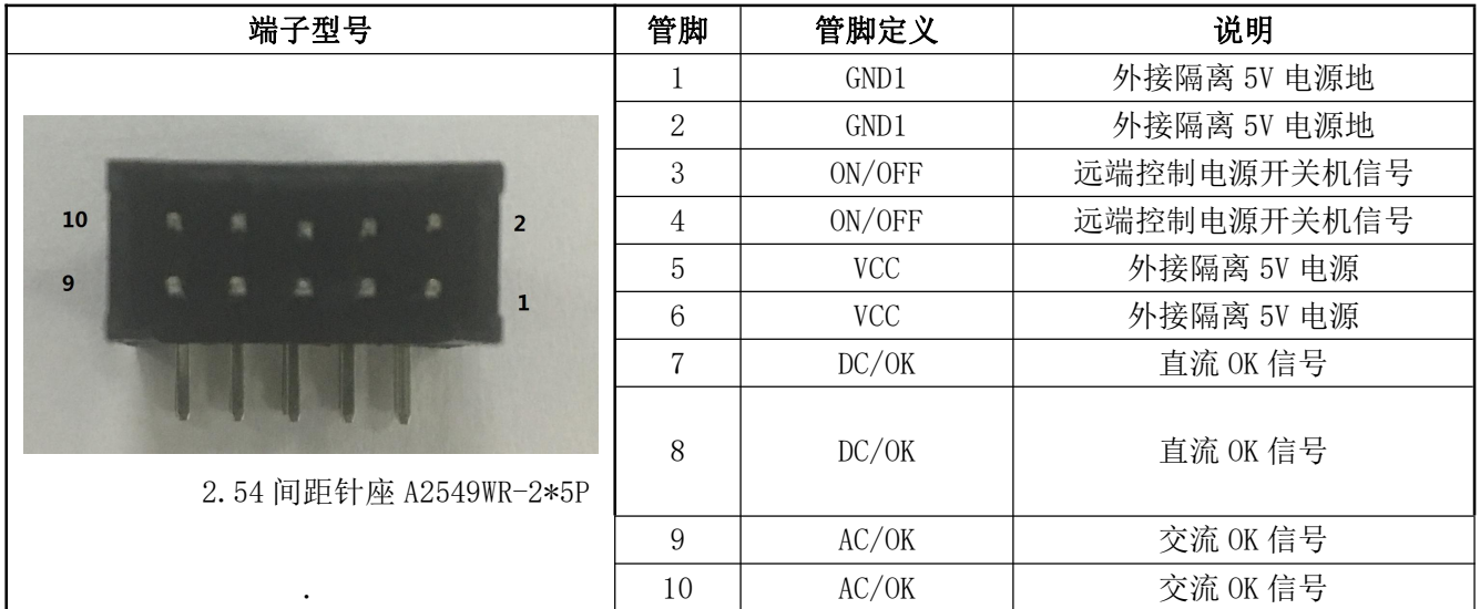
表 13 输出管脚定义表