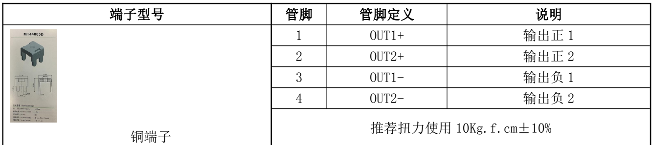
表 11 输出管脚定义表