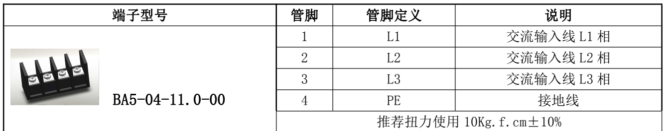
表 11 输入管脚定义表