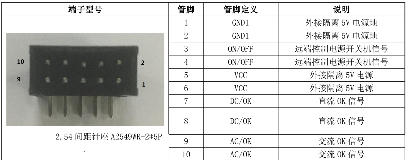
表 13 输出管脚定义表