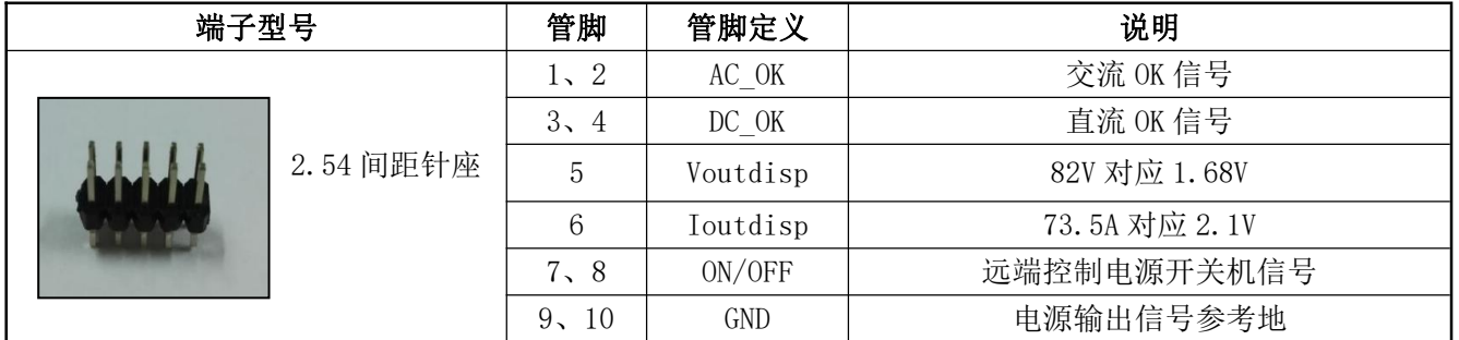
表 13 输出管脚定义表