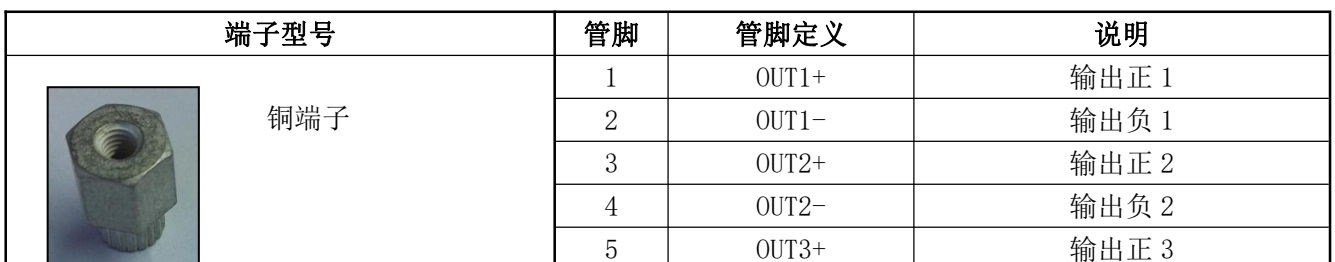
表 12 输出管脚定义表