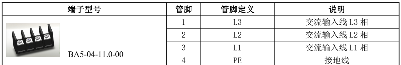
表 11 输入管脚定义表