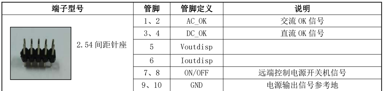
表 13 信号端子管脚定义表 1