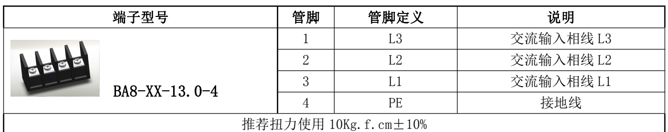
表 10 输入管脚定义表