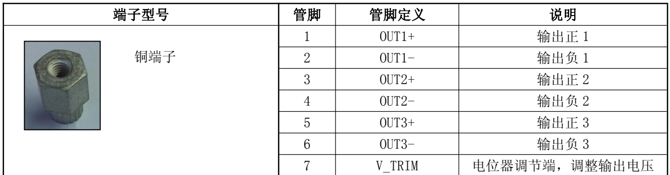
表 12 输出管脚定义表