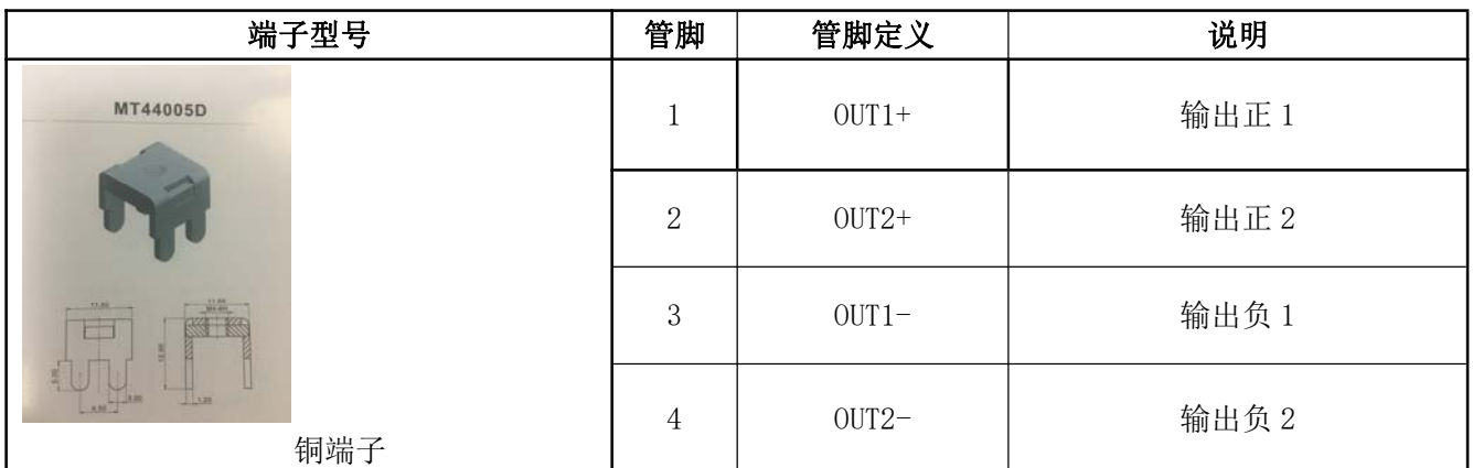
表 12 输出管脚定义表