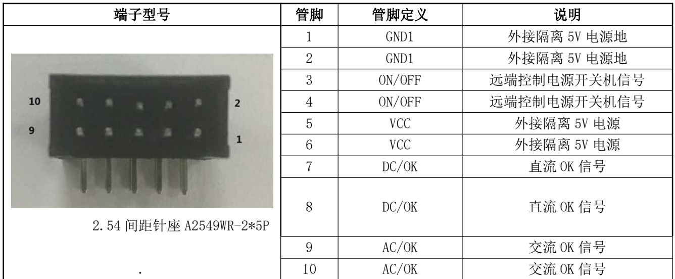
表 13 输出管脚定义表