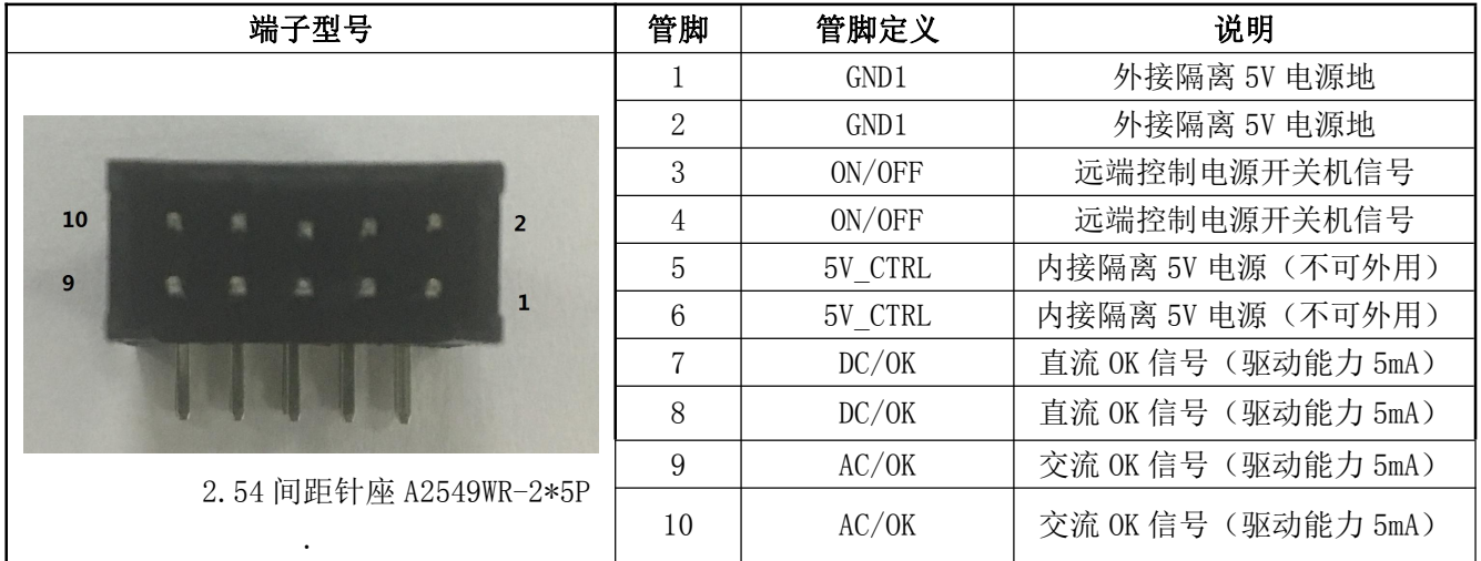
表 12 信号端子管脚定义表

注释: 1; 外部将 GND1 与 ON/OFF 短路即可控制模块开关机, GND1 与 ON/OFF 断开模块关机。 (客户需要配信号线)