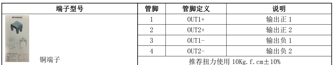
表 11 输出管脚定义表