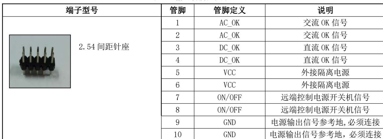
表 13 输出管脚定义表