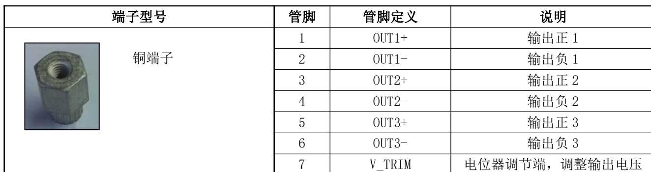
表 12 输出管脚定义表